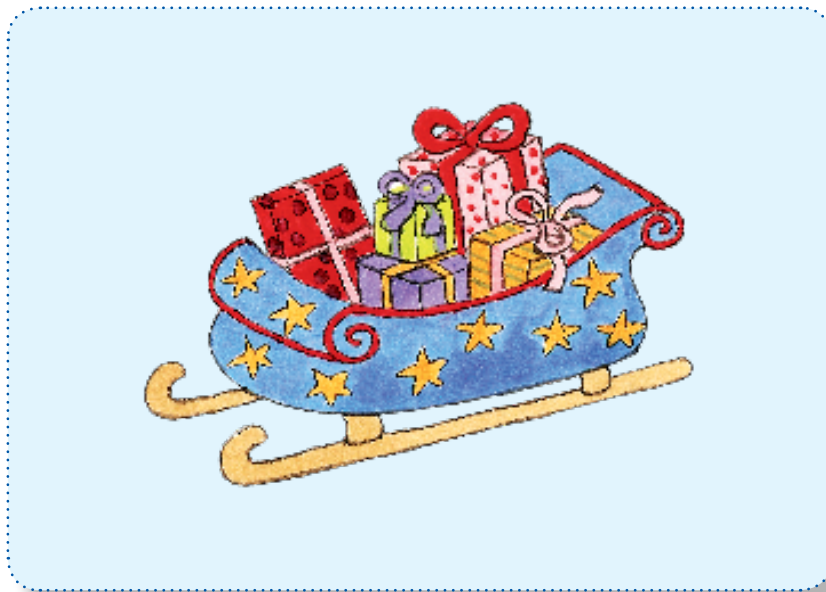
Illustration: Anja Goossens